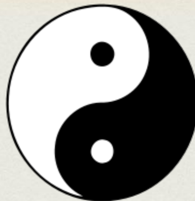
Taiji Tu 太极图

“Yin e Yang sono la via del Cielo e della Terra” (Huangdi Neijing)